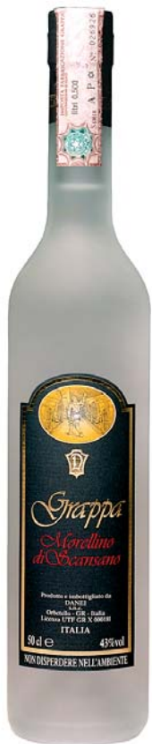
Morellino di Scansano

Ottenuta dalla distillazione a vapore discontinua diretta delle vinacce di Morellino di Scansano DOCG Gradazione alcolica 43°