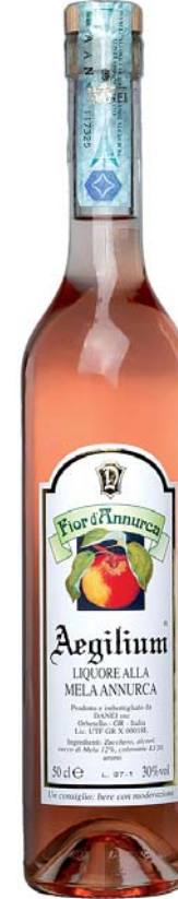
Fior d'Annurca LIQUORE ALLA MELA ANNURCA