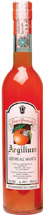
fior di Arancio LIQUORE ALL'ARANCIA