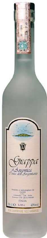
di Ansonica Costa dell'Argentario