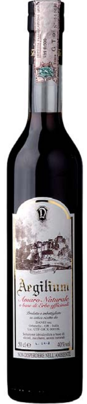
Aegilium Amaro Naturale a base di Erbe officinali

Liquori nei quali sono stati raccolti tutti i pregi e le qualità della frutta.