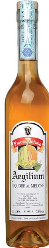
Fior di Melone LIQUORE AL MELONE