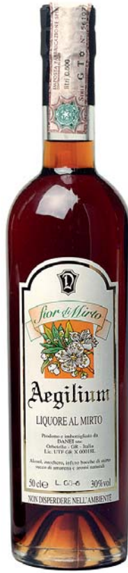
fior di Mirto LIQUORE AL MIRTO