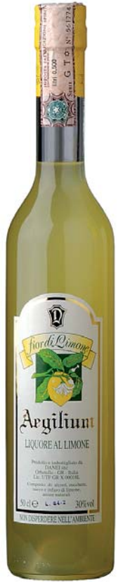
fior di Limone LIQUORE AL LIMONE